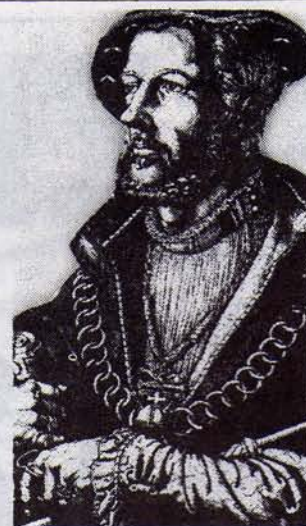
Jan de Leyde.

Dans une société communiste, les hommes s'associeraient pour accomplir telle ou telle action, pour partager les plaisirs ou les émotions et répondre aux besoins généraux de la communauté, sans que le regroupement qu'ils formeraient ainsi prenne la forme d'un Etat, donc de la domination de certains hommes sur d'autres, ou prenne la forme d'une entreprise qui embauche des salariés et qui monnaie la production. Par conséquent, on ne peut parler, pour une telle société, de lois économiques. Ces lois, étant l'expression des relations humaines reposant sur l'inégalité et la domination de certains; inégalité, domination, qui justifient elles-mêmes ces lois en les présentant comme des réalités inévitables ou ayant existé de toute éternité. Au contraire dans la société communiste, il existerait un contrôle conscient des êtres humains sur leur propre activité au travers tant des relations existant entre eux que, plus généralement, des